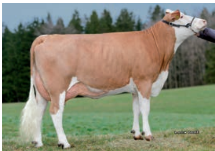
PERFEKT: WALSER PERFEKT FLOCKE 1