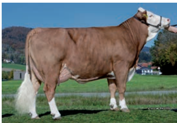
HERMELIN: JELLBAUER HERMELIN LERCHE 1