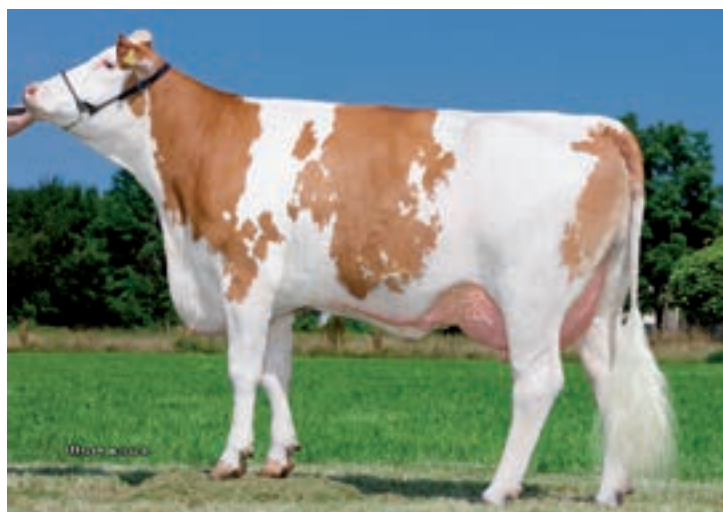
VARTA: NIEDERMAIR VARTA PERU 1