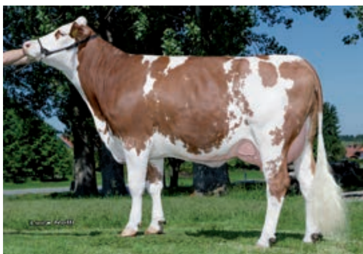
HERMELIN: HISCHVOGL HERMELIN LILLI