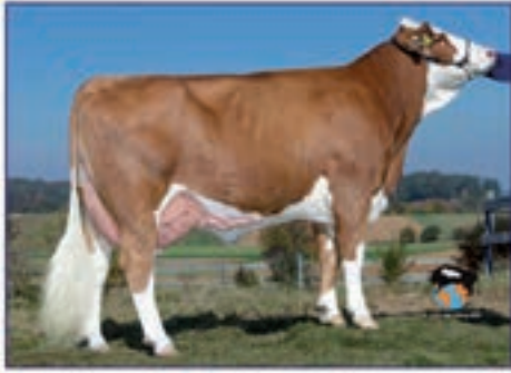
NONNA - GLASA DE0950350380 (MINT)

PARTO FACILE - FITNESS 120 - LATTE, CASEINE, GESTIONALI E OTTIMA RESA CARNE