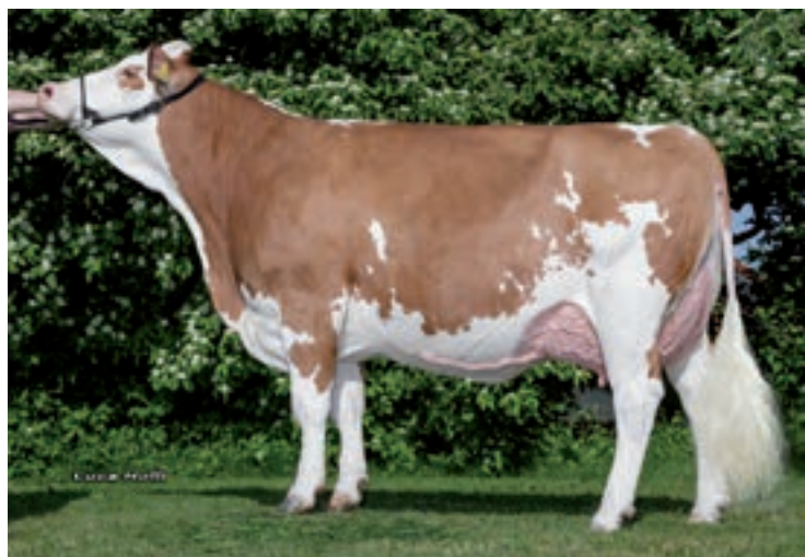
HERMELIN: BURGER HERMELIN READY