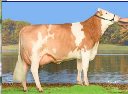
MAMMA - PAOLA PP