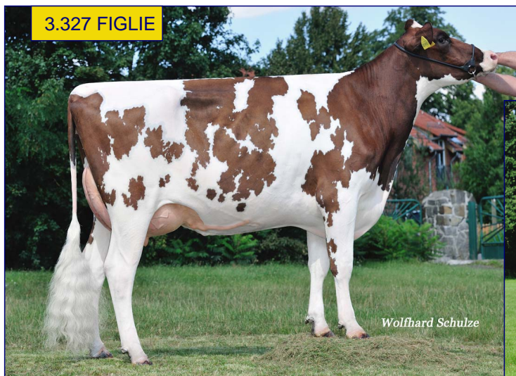
FIGLIA - SL PALMA RED VG85