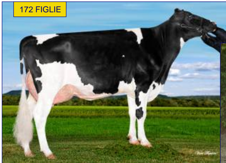
NONNA: BUTLerview LET IT SHINE VG86

CASEINE - SUPER PRODUZIONI STRONG FAMILY