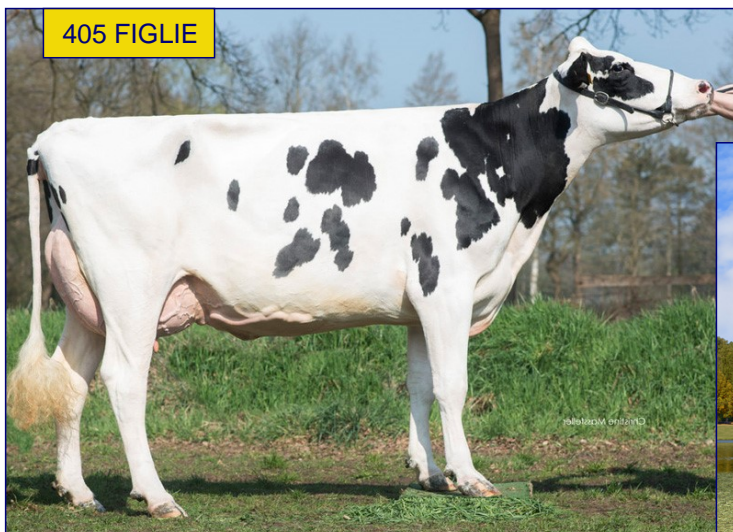
NONNA: GGA JENA 2