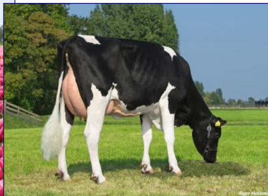
FIGLIA - GRIET 234 V-2