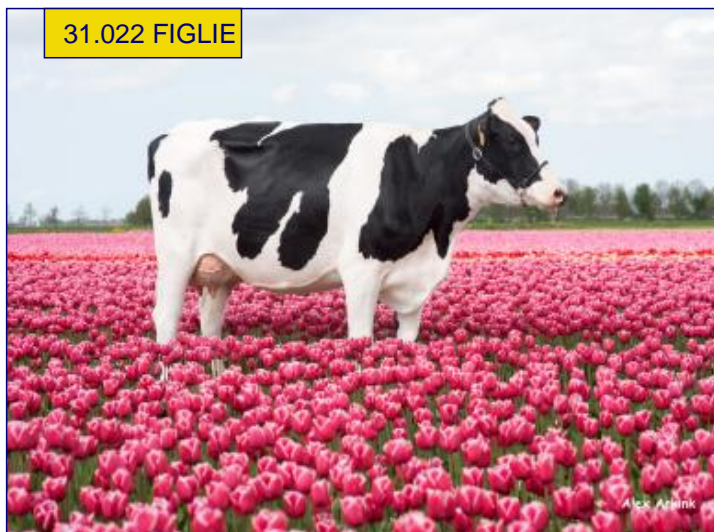
FIGLIA - NEWHOUSE SNEEKER 548-3