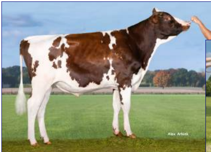
FRANK PP RED

PARTO FACILE - SUPER TITOLI, KG DI GRASSO E PROTEINE, OTTIMI GESTIONALI