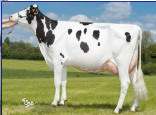
BISONNA: FILI-SHER RDC VG-86

PARTO FACILE - SUPER TITOLI, KG DI GRASSO E PROTEINE, OTTIMI GESTIONALI