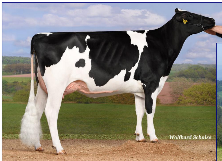
MAMMA: WKM SKY LADY VG-85