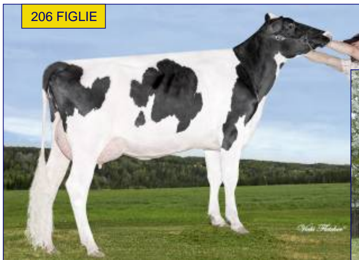
BINONNA - BEAUCOLSE PLANET PLANE VG86