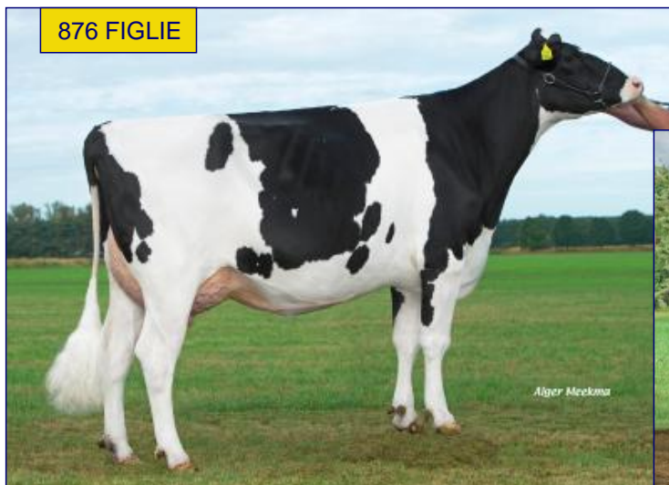
P MAMMA - DELTA RABI RF VG85