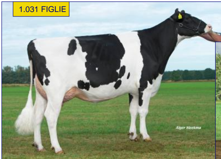
P MAMMA - DELTA RABI RF VG85