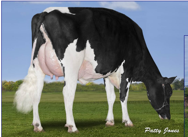
BISNONNA: CALBRETT PB SANGRIA PP-ET