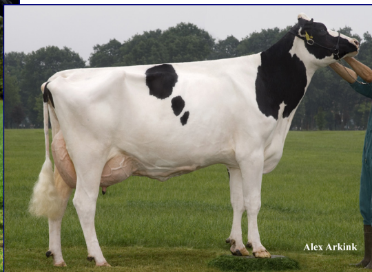
NONNA - BROEKS MBM ELSA EX90