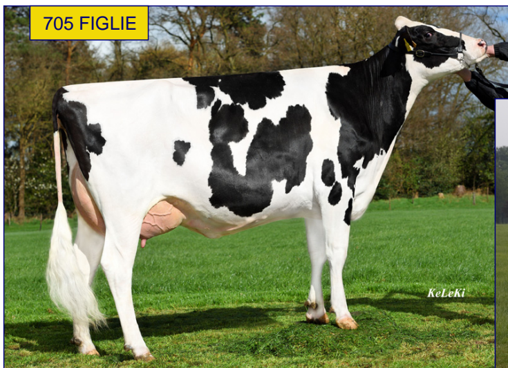
FIGLIA - CHERRY GP84