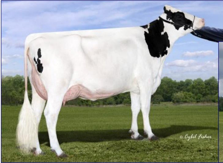
MAMMA: AURORA EXPRESSO 17922-ET