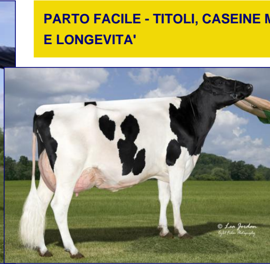
NONNA: AURORA COMMANDER 16020-ET VG-85

PARTO FACILE - TITOLI, CASEINE MORFOLOGIA E LONGEVITA'