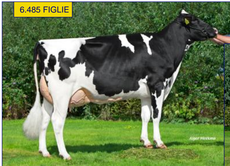
FIGLIA: DELTA JOSKA V