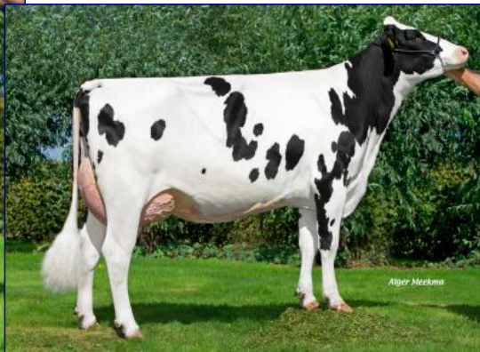
FIGLIA: DELTA RUWEDA V