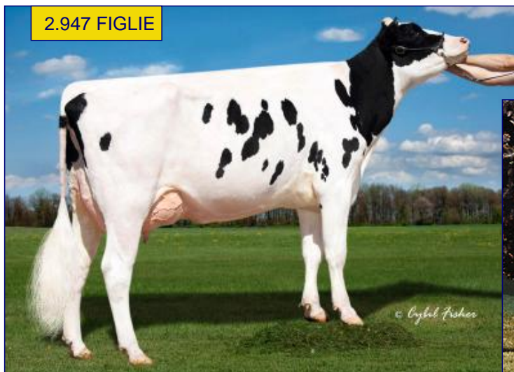
MAMMA - OCD MOGUL ABRACADABRA VG86